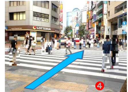
④ 横断歩道を渡り『サンシャイン60通り』へ200メートルほど(約3分)お進みください。(左手にロッテリアがございます)