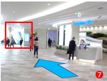
⑦ 「Sunshine City」の案内表示がございますので、エスカレーターにて1階へお進みください。