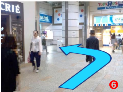
⑥ エスカレーターを下り、左方向へお進みください。(動く歩道がございます)