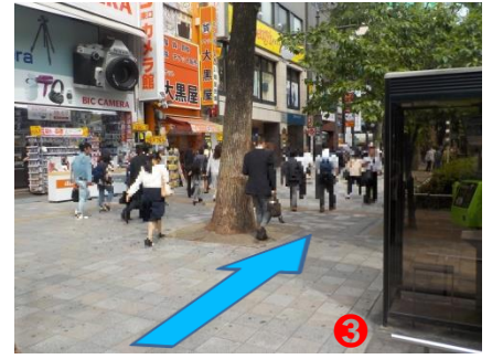
③ 出口を出ましたらそのまま道なりにお進みください。