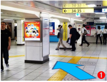
① 東口方面へ向かい『35』番出口方面へお進みください。