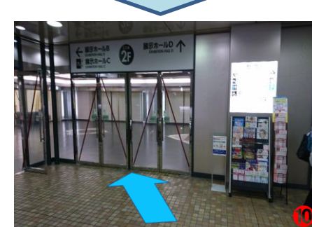
⑩ エスカレーターを上がってまっすぐお進みいただくと、文化会館2階展示ホールDへ着きます。

【日時】2019年10月30日(水)10:00~17:00(ご入場は16:30まで)