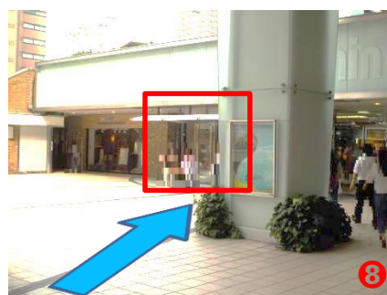
⑧ 上がりましたら斜め右方向『Sunshine City』へお入りください。そのまま約4分ほど道なりにお進みください。(お進みいただくと、文化会館ビル入り口に着きます。)