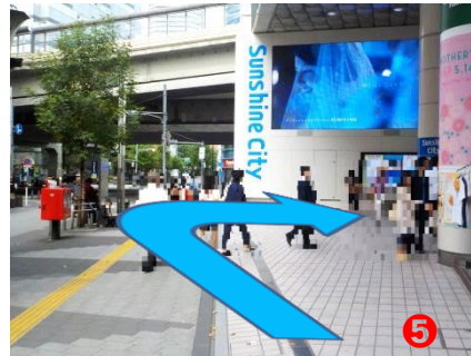
⑤ 右手に『東急ハンズ』がございますので、『サンシャインシティ地下道入口』のエスカレーターをご利用ください。