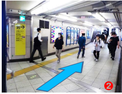
② エスカレーターをお上がりいただくと『35』番出口がございます。