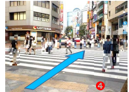
④ 横断歩道を渡り『サンシャイン60通り』へ200メートルほど(約3分)お進みください。(左手にロッテリアがございます)