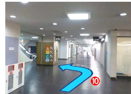
⑩ エスカレーターを上がりましたら、左手に上りエスカレーターがございますので、さらにフロアを一つお上がってください。(お進みいただくと、文化会館3階<展示ホールC>へ着きます。)

【日時】2017年10月25日(水) 10:00~17:00(ご入場は16:30まで)