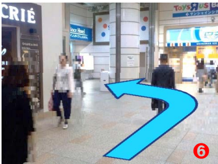
⑥ エスカレーターを下り、左方向へお進みください。(歩く歩道がございます)