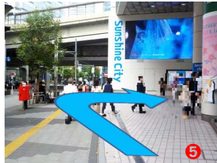
⑤ 右手に『東急ハンズ』がございますので、『サンシャイン通り地下入口』のエスカレーターをご利用ください。