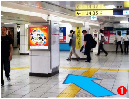
① 東口方面へ向かい『35』番出口方面へお進みください。