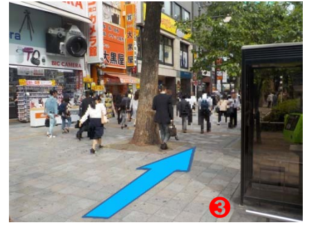
③ 出口を出ましたらそのまま道なりにお進みください。