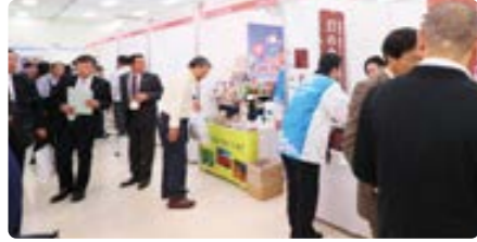
昨年を上回る商談ブースが出展