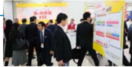
試食・販売もあり