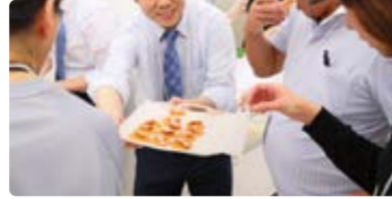
試食できるブースもあり